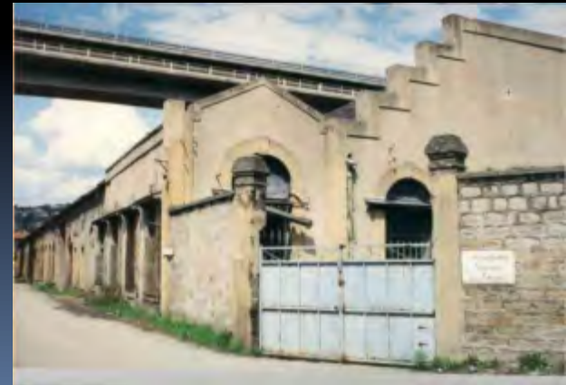
Halle Bessemer de Terrenoire, Inventaire du Patrimoine, 1987